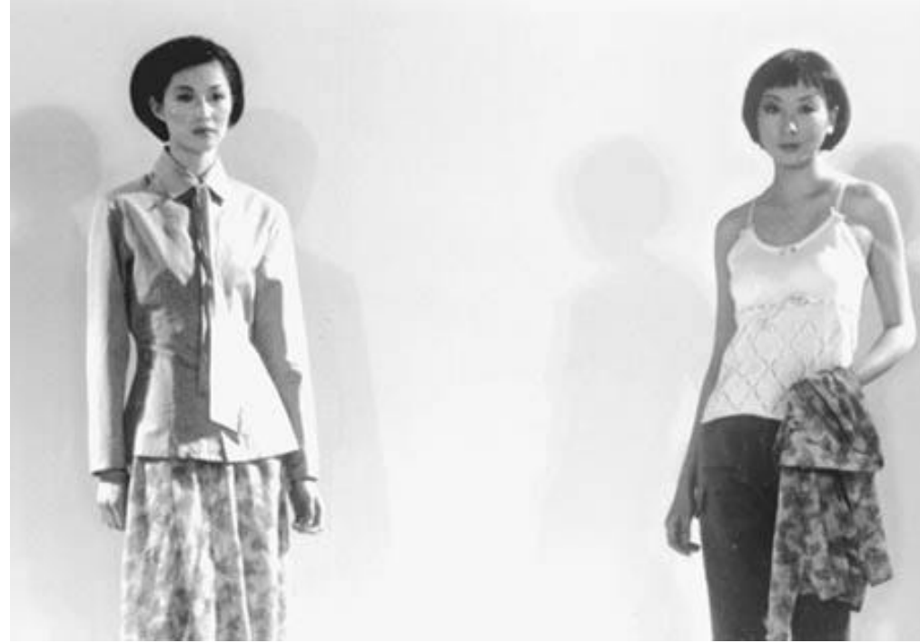
‘99春夏流行趋势发布。

透明轻薄的面料是最新流行的魅力所在。层层叠叠透明有一种朦胧的感觉，健康与舒适则诠释了全新的流行信息。一股转向轻松与休闲的趋势影响了整个时尚界。此中的经典是长裙和连衣裙的流行线条，宽松裁剪的长裤。